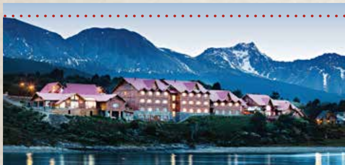
· HOTEL LOS CAUQUENES

A orillas del Canal Beagle y a espaldas de la Cordillera de los Andes. Miembro del prestigioso grupo Small Luxury Hotels of the World, tiene 54 habitaciones. Es uno de los tres hoteles 5 estrellas de Ushuaia.