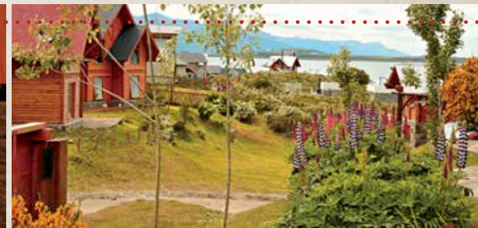
· CABAÑAS BAHÍA CAUQUÉN

Cuenta con 62 locales y 15 góndolas comerciales, un gimnasio (Sportclub), cuatro cines (Sunstar), un espacio de entretenimientos (Playland) y un patio de comidas.