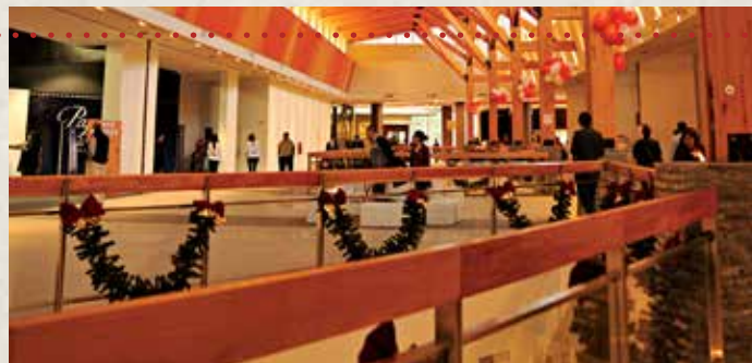
· PASEO DEL FUEGO SHOPPING CENTER

A orillas del Canal Beagle y a espaldas de la Cordillera de los Andes. Miembro del prestigioso grupo Small Luxury Hotels of the World, tiene 54 habitaciones. Es uno de los tres hoteles 5 estrellas de Ushuaia.